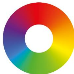
CMY míchání barev